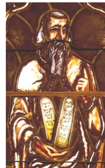
Moïse et les tables de la Loi, vitrail de M. Poncet, St-Paul

Quête : pour les besoins de notre paroisse