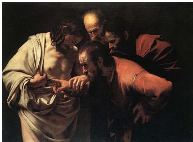
Le Caravage : « L'incrédulité de Saint Thomas »